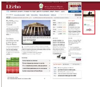
Banner vertical - logos