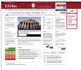
Banner vertical - liens textes