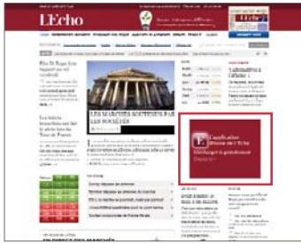
Advertorials - position 1